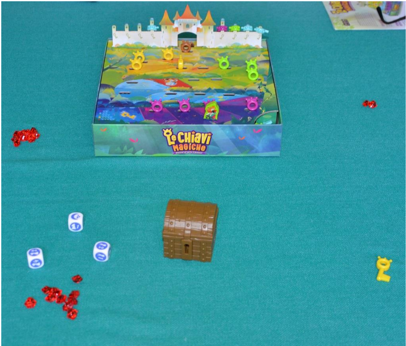
Foto 4 – Partita in corso: il viandante è arrivato a metà percorso.

Se dopo un lancio tutti i dadi mostrano la Luna il giocatore termina il suo turno senza prendere chiavi e il segnalino Viandante deve tornare all'inizio della pista per il prossimo "cliente". Se ottiene tre lune "al primo lancio" il giocatore sposta il Viandante sulla casella rossa al centro del percorso e rilancia tutti i dadi, proseguendo come al solito.