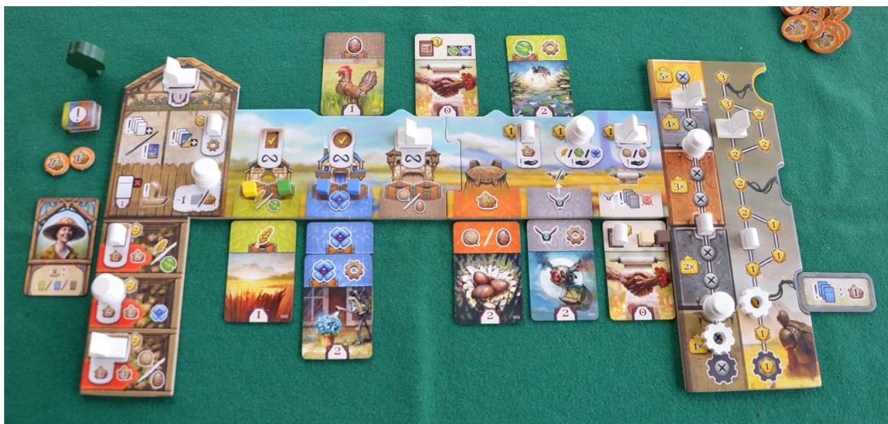
Foto 8 – Esempio della plancia di un Giocatore dopo i primi turni.

(c) – prendere una carta dell'avversario pagando a lui il numero e il tipo di risorse che vi si trovano sopra e posizionando la carta in una colonna della fattoria. I cubetti che si trovavano sulla carta "rubata" restano al giocatore avversario, che deve immagazzinarli.