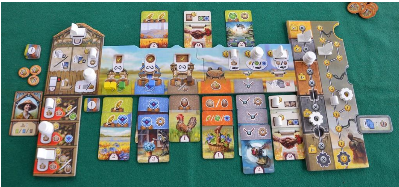
Foto 9 – Ecco come si presenta la plancia personale a metà partita.

La quinta colonna è molto importante perché ci mette a disposizione dei Bot volanti per il trasporto delle Risorse (ognuno può spostare un cubetto). Per soddisfare un Ordine dovremo dunque scegliere una carta grigia, posizionarla nella quinta colonna e poi spostare tanti cubetti quanti sono i Bot disponibili, magari completando quell'ordine e iniziandone un altro.