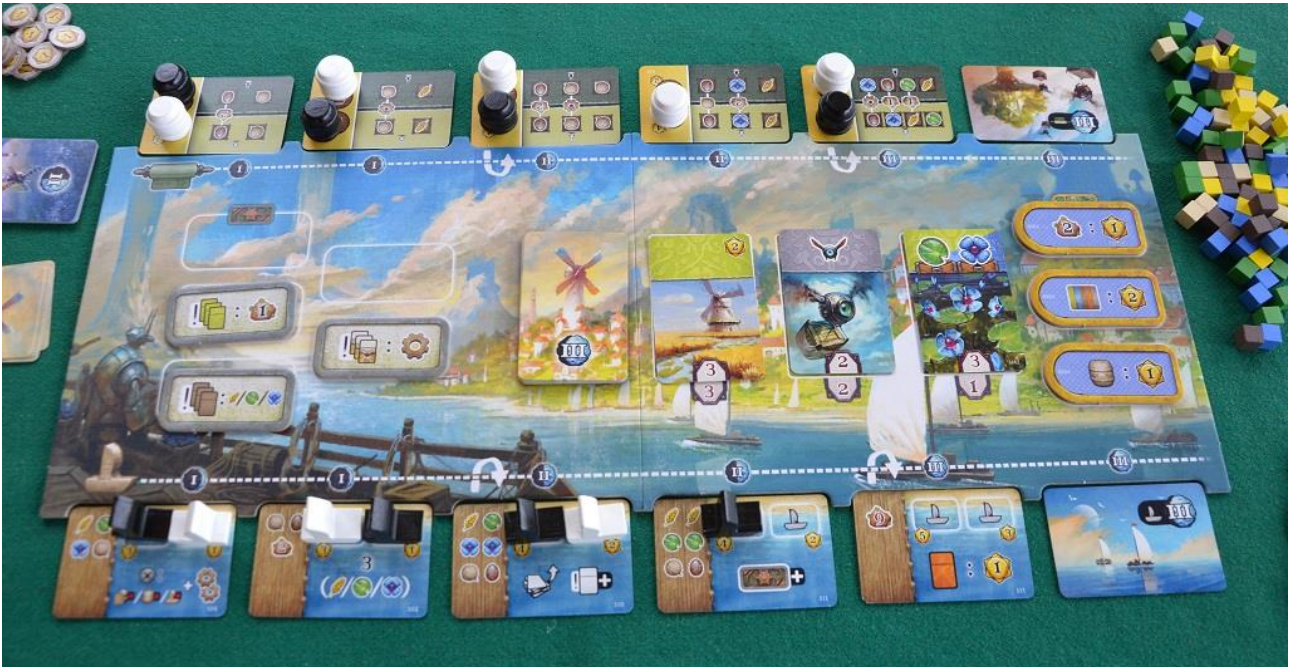
Foto 11 – Il tabellone verso la fine della partita: notate le botti e le navi già consegnate.

La colonna di sinistra è un moltiplicatore dei punti di destra: nel nostro esempio vediamo che l'ingranaggio è nella fascia "x3", quindi il giocatore avrebbe guadagnato, in quel momento, 3 \times 2 = 6 PV. In questa colonna non è possibile evitare gli ostacoli, quindi bisogna programmare bene le proprie azioni per liberare in tempo il percorso. Notiamo al passaggio che se entrambi gli ingranaggi arrivano in cima (cosa che avverrà quasi sempre se i giocatori sono attenti) il malloppo arriva a 15 PV.