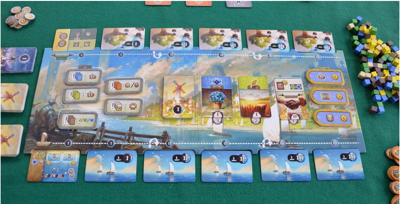
Foto 5 – Il tabellone ad inizio partita: notate che ci sono solo due carte scoperte ai suoi bordi: una Spedizione (fila in basso) e un Ordine di Consegna (fila in alto).

Facciamo un piccolo passo indietro per spiegare come è stato preparato il tabellone di Suna Valo , così il seguito sarà molto più chiaro. Per prima cosa abbiamo preso casualmente due carte Ordine di Consegna di ogni Livello, posizionandole coperte sul bordo superiore del tabellone) e due Spedizioni per Era (posizionandole sul bordo inferiore). Ad inizio partita si gira la prima carta di ogni fila (come mostrato nella Foto 4).