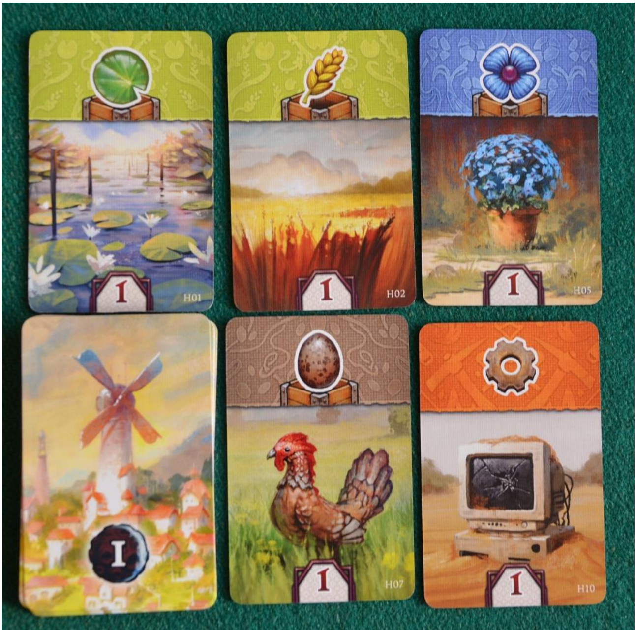
Foto 4 – Esempio di Carte Fattoria del primo livello. Notate che ogni Risorsa è accompagnata da un nuovo magazzino.

Le carte Fattoria sono divise in tre mazzetti, uno per Livello (o Era, come dicono le regole): come vedete (Foto 4) ogni carta è divisa in tre zone: in alto ci sono un simbolo (risorsa o azione) e una cassa (magazzino, ma solo per le risorse), al centro vediamo un'illustrazione e in basso un "valore" numerico.